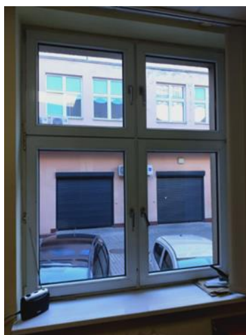
Wygląd jednego z okien, obecnie znajdujących się w nieruchomości

Wszystkie okna powinny być dopasowane wyglądem do wymienionych uprzednio okien z PCV.