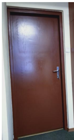
Wygląd jednych z drzwi do pokoju biurowego, obecnie znajdujących się w nieruchomości

Niektóre z drzwi spełniać muszą dodatkowe kryteria, co wskazane zostało w powyższej tabeli z zestawieniem.